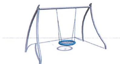
Balançoire Nid d'oiseau